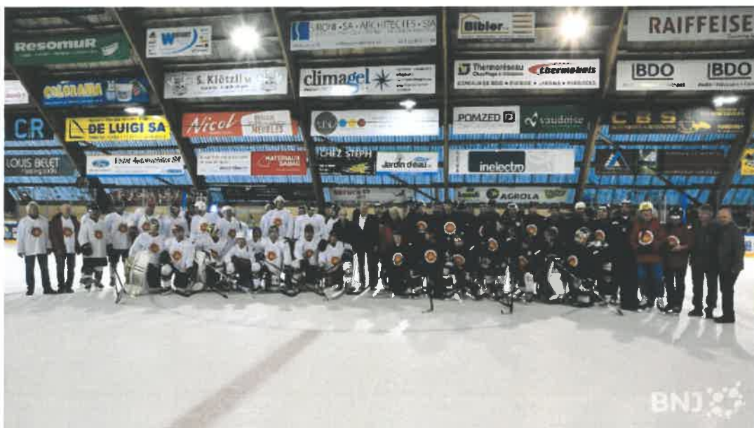
Les acteurs de cette rencontre de gala ont posé une dernière fois sur la glace du Voyeboeuf.

C'est avec beaucoup d'émotion que s'est disputé samedi soir à Porrentruy le match des Étoiles, qui a marqué l'au revoir du HC Ajoie à sa patinoire