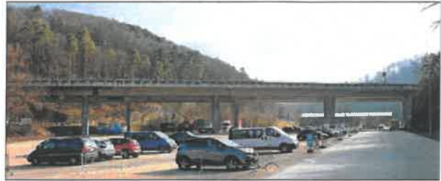
Le parking du Voyebœuf à Porrentruy est occupé par les véhicules des supporters du HC Ajoie les soirs de match, mais accueillera aussi le chapiteau du Cirque Starlight tout prochainement.

► Depuis le début des travaux de la patinoire, les véhicules s'accumulent au parking du Voyebœuf les soirs de matchs du HC Ajoie. ► Le HCA joue les play-off et le Cirque Starlight monte bientôt le chapiteau: un élu PLR craint la congestion les soirs de match. ► L'exécutif bruntrutain estime que la situation n'est pas nouvelle dans le secteur.